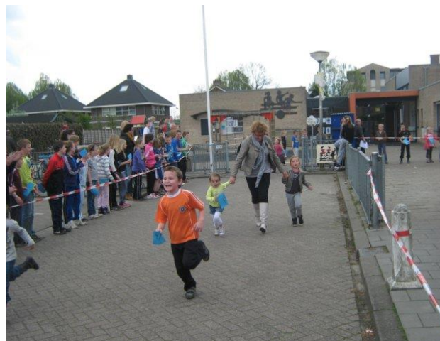
Sponsorloop om geld op te halen voor Stichting Klasse Feest

Ook hier is er gelegenheid voor een kopje koffie/thee.